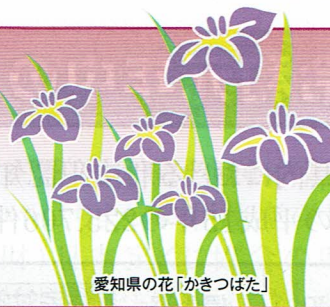
愛知県の花「かきつばた」

発行所：(公社)愛知県防犯協会連合会 名古屋市昭和区円上町26番15号 (愛知県高辻センター 2階) (052) 871-2110